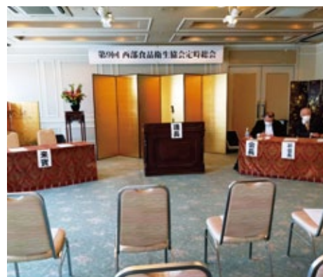
西部支所 於：神戸飯店