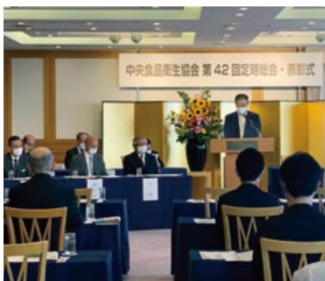
中央支所 於：ホテルオークラ神戸