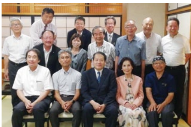
垂水支所 於：増田屋本店