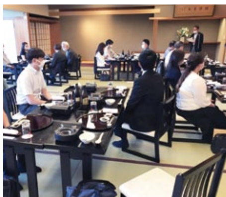
北支所 於：ねぎや陵風園