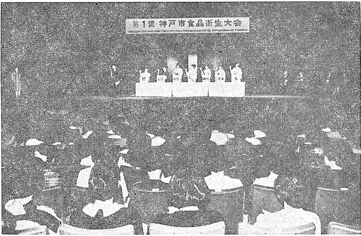
食品衛生大会の抽せん風景 (於国際会館)