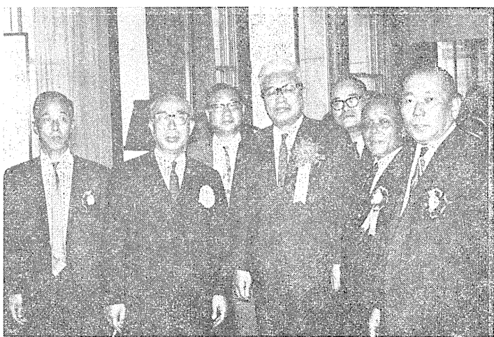
大臣を囲んで喜びにあふれる栄えの授賞者たち