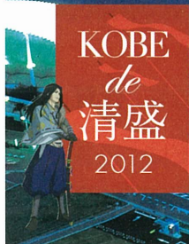
神戸港ハーバーランド夜景