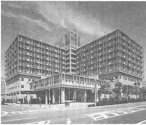
〔西神戸医療センター〕

あけましておめでとう... 市民の平和でしあわせな生活を確保するためには、新たな神戸市総合基本計画に沿って、市民、事業者のみなさんと市が協働してまちづくりを推進していくことが必要だと考えています。さて、これからの十年は、神戸の街の骨格をつくるうえで重要な期間であると考