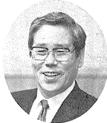
神戸市長 笹山幸俊

あけましておめでとうございませう。二十一世紀に向かって、私は神戸を、世界に開かれたアーバンリゾート都市として、まち全体が活力に満ち、