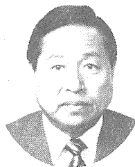
神戸市衛生局長 吉川正

神戸市食品衛生協会の皆様、あけましておめでとうございませう。昨年は、衛生行政をはじめ市政の各般にわたり、格別のご理解とご協力を賜わり厚くお礼申し上げます。