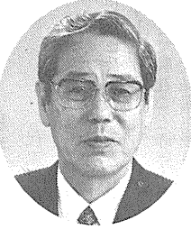
神戸市長 笹山幸俊

神戸市民のみならず、あけましておめでとうござい... 市政を担当して初めての新春を迎え、本年を「新しい神戸」を築くための第一歩を踏み出す年にしたいと考えております。